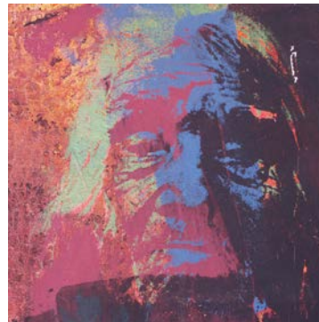
'José del Tránsito Neipan Collipai'

Pigmento y serigrafía sobre velo 120 x 120 cms. 2019