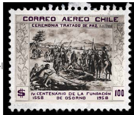
TRATADO DE LAS CANOAS